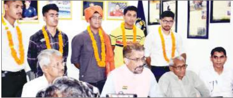
टीम एक्शन इण्डिया/ कुरुक्षेत्र (दलबीर मलिक)

एनडीए में ऐतिहासिक उपलब्धि प्राप्त करने वाले छात्रों का गुरुकुल पहुंचने पर भव्य स्वागत किया गया। एनडीए में गुरुकुल के 11 छात्रों का चयन हुआ है जिनमें से 5 छात्र