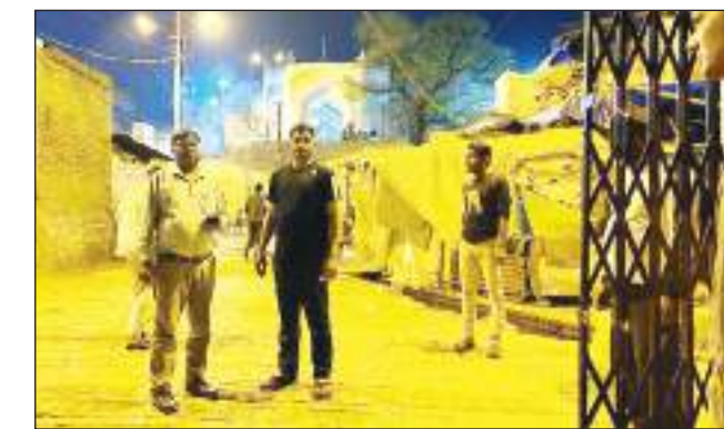
बिहारी जी मंदिर आने वाले श्रद्धालुओं के लिए पवनहंस हेलीपैड एवं हेलीपैड के सामने नगर निगम की भूमि पर अतिरिक्त अस्थाई

टीम एक्शन इंडिया/मथुरा। नगर निगम मथुरा वृन्दावन द्वारा अक्षय तृतीया एवं ईद पर्व के दृष्टिगत विशेष व्यवस्थाएं की गई हैं। ईद के दृष्टिगत शाही इंदगाह के साथ साथ नगर निगम क्षेत्रांतर्गत सभी मस्जिदों के आस पास एवम संपर्क मार्गों पर विशेष सफाई, रंगीन चूना छिड़काव करायो। इसी के साथ नगर निगम के अधिकारियों द्वारा स्वयं निरीक्षण कर समस्त मस्जिदों के पास मार्ग प्रकाश व्यवस्था को दुरुस्त कराया गया है। डींग गेट चौराहे पर लाइटिंग की गई है। अक्षय तृतीया पर्व पर श्रीबाके